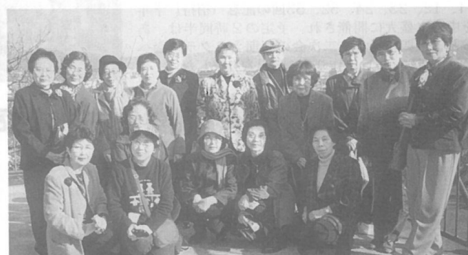
高校4回E組 H13年11月21日 昨年春の鎌倉散策のクラス会が大好評で今回は秋を楽しみました。