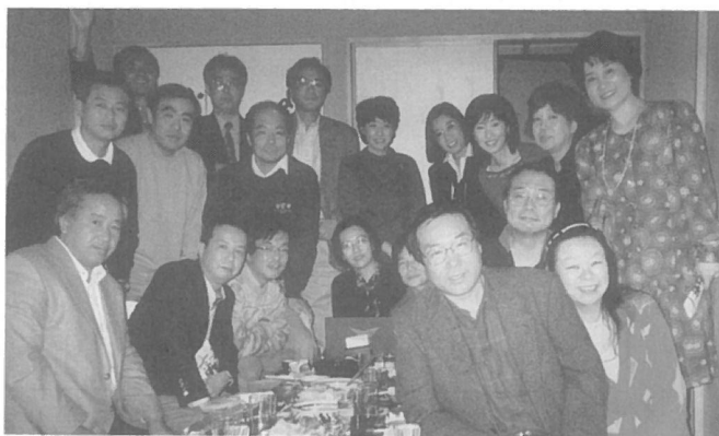
高校23回F組 H13年11月17日 (銀座・魚屋宗兵衛) 連絡の途絶えていたクラスメートを様々な方法で見つけました。