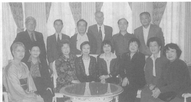
高校7回B組 H13年4月14日 (赤坂プリンスホテル)