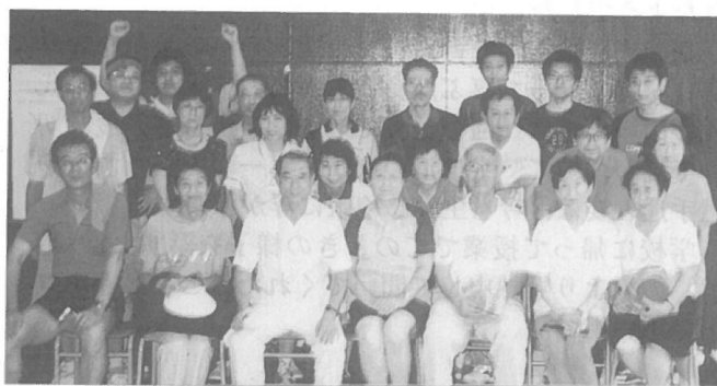
卓球部OB・OG会(草門会) H13年7月14日 (母校) 毎年7月頃母校体育館で開催し、札幌、仙台、長野在住の方も参加しています。