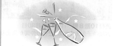
高女4回・高校1回(同ホテル内) 井草と言う縁(えにし)でしっかりと結ばれています。