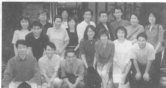
高校26回F組 H13年6月10日 (新宿・T-HUT) クラス会の間は皆高校生に戻れる楽しい時間でした。