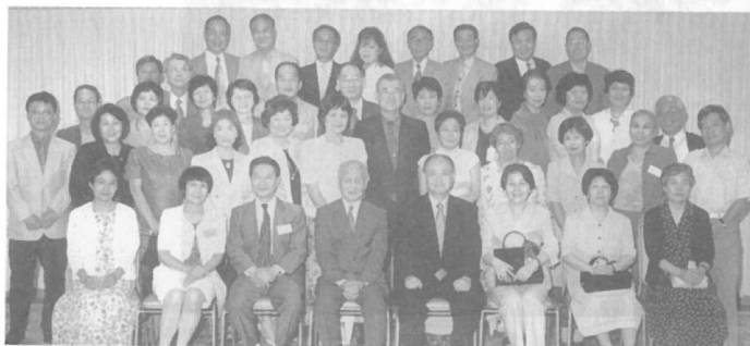
高校11回(同ホテル内) 懐かしいフォークダンスの曲であの頃に戻りました。