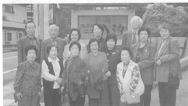
高校7回E組 H13年10月20日 65才を記念した一泊二日の塩原温泉旅行・クラス会を開催。